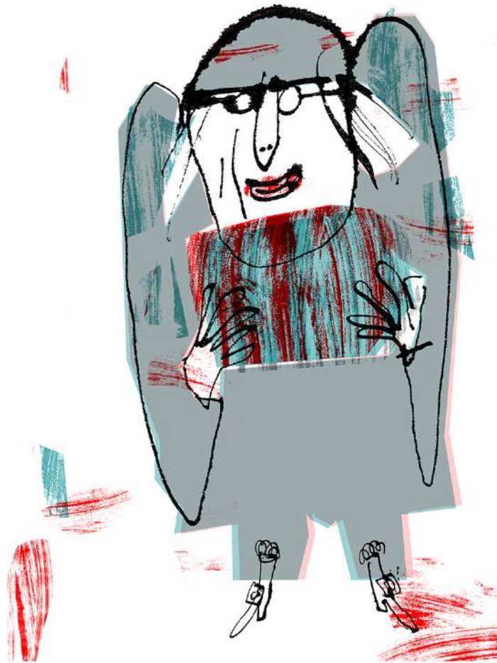
illustration © Serge Bloch / Théâtre National Populaire